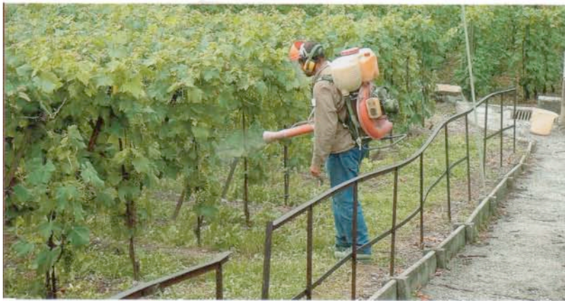
Das Aufgabengebiet des Arbeitshygienikers geht über den Bereich der Industrie hinaus.